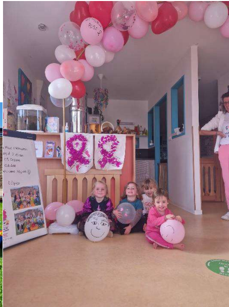
Octobre rose 2023